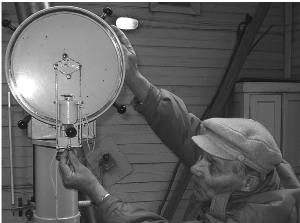
Во время обсуждения деталей конструкции зенит-телескопа ЗТФ-135

киваться по роду работы, он находил узлы, которые могли быть усовершенствованы, и не только находил, но и часто собственными руками их действительно улучшал.